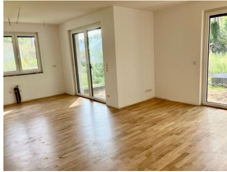
Parkett im Wohnzimmer