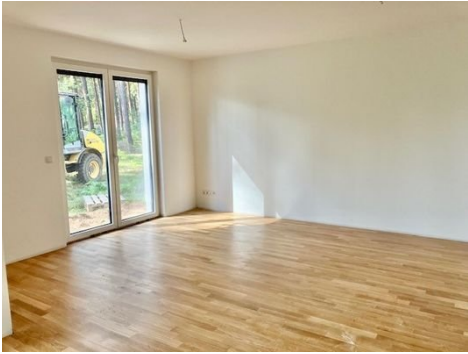
Parkett im Wohnzimmer