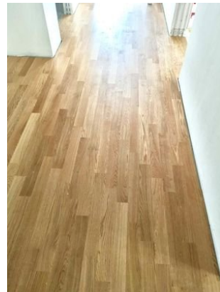
Parkett im Flur