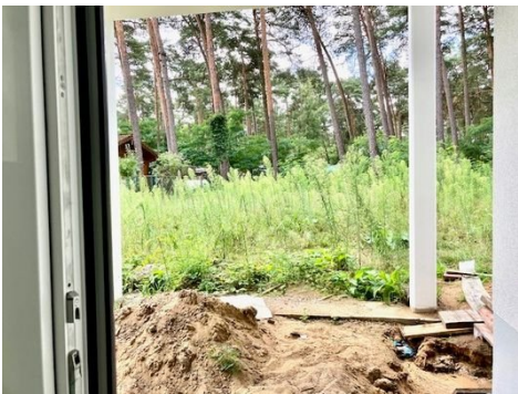
Blick ins Grüne