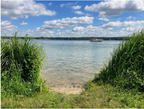
der benachbarte Strand