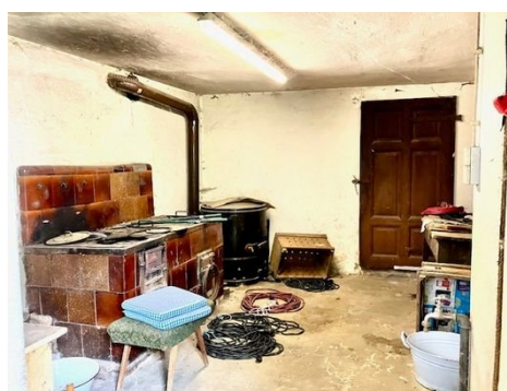
Waschküche in Scheune