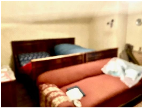
Zimmer auf dem Dachboden