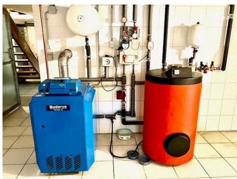
Heizung Buderus im Keller